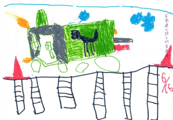
在高速公路上的宅急便 鯨魚班 林秉義 繪

當初我就帶著實驗的性質選擇幼稚園，我就不相信幼稚園沒有偷跑以後會輸給同儕，事實已然得證， 重點絕對不在於幼稚園先學了多少，重點在於能讓孩子保持熱切學習的心。 在新樓，那顆心一直溫溫柔柔的被滋養著，帶著這顆心到國小接觸更廣闊的學習領域吧！