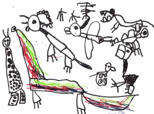
恐龍 鯨魚班 林秉義

推開大門後，不意外，景色和相片上的一樣「天然」，大樹、雜草、沙堆、陳舊的玩具.....。卻有著說不出的親切與熟悉感。辦公室前那些有著破損痕跡的童書、繪本更是讓我覺得「真實」。「這才是一間真正不怕孩子玩、不怕孩子看書的幼稚園吧！」心底的聲音不斷低迴。小樂更是眼睛一亮，直嚷著要玩這、要玩那的；尤其那一大片沙地，