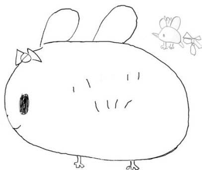
小小奇異鳥 老鷹班 韞璞 繪

每天見到鳥媽媽在電扇裡裡外外地穿梭，用心築巢、用心孵蛋、照顧小鳥，而天氣，是越來越熱了。飛機班小孩全體決議，電扇開關變成紅燈區，用膠帶貼起來。小孩們也會熱、也想要涼快，但是他們可以因為愛護小鳥選擇不吹電扇，選擇小鳥有可能會大便在他們吃飯的地方。這麼小的孩子有能力揣想他人的需要，與自己的需要並置衡量後，將他人的需要置於自我之上，這是何等溫柔的景象！而當小鳥一天天長大，小朋友也一天天長大的時候，我們知道，這樣的溫柔會在他們的心裡留下痕跡。所以，我們家會有溫柔照顧弟弟的姐姐，弟弟會因為有溫柔的姐姐牽著他的手，而能勇敢離開媽媽去上學，這樣長大的方式何其美好！